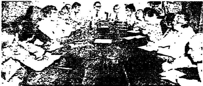
الرئيس الحص والنيق كرمخلال الندوة

بالتام وموفقا صريح ويجب ان نخل في مؤتمر جيف خاصة فيما يتعلق بالسلام في الشرق الأوسط. أما في قضية الأراضي فنحن غير متعدين بذلك لان لنا وضعا خاصا . جولة بطرس